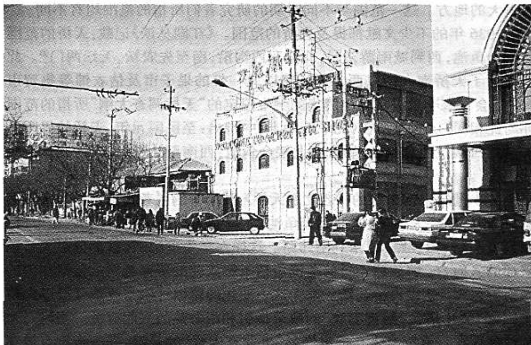
图二：解放后在天桥万盛轩剧场旧址上翻建的万胜剧场。