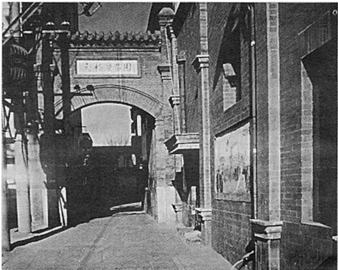
图一：在昔日天乐戏院旧址上重建的天桥乐茶园，现在每天晚上仍有不少天桥老艺人及其传人在此演出。