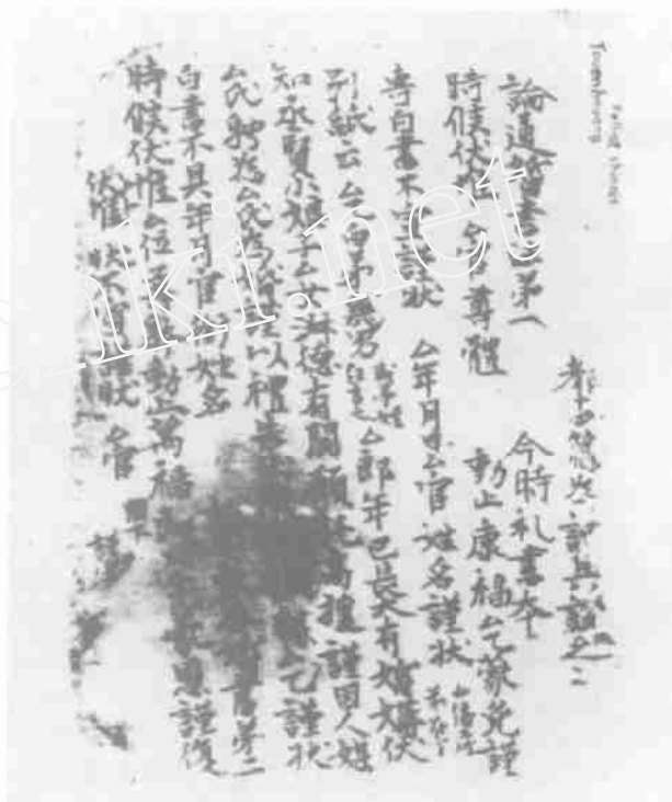
敦煌卷子 《论通婚书法》第一 《今时礼书本》

《仪礼》在器物摆放的方式、人物的服饰、相见的礼节、步骤等具体的行为方式上也有详细的规定：“主人筵于户西，西上，右几。使者玄端至，摈者出，请事，入告。主人如宾服，迎于门外，再拜，宾不答拜，揖入。至于庙门，揖入；三揖，至于阶，三让。主人以宾升，西面。宾升西阶，当阿，东面致命。主人阼阶上，北面再拜。授于楹间南面，宾降，出，主人降，授老雁。”这些充分体现此时行为是一种礼的表现方式，是一种有象征意义的行为。